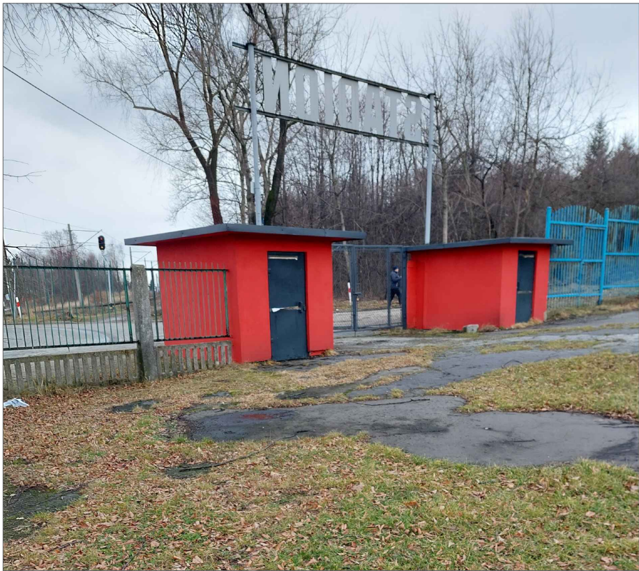
WIDOK KAS -TYŁ

UWAGA: 1. Wymiary sprawdzić na budowie. 2. Nie wyklucza się istnienia w terenie innego uzbrojenia nie zgłoszonego do inwentaryzacji prac oraz nie wykazanego przez instytucje branżowe. 5. Sieci nie widoczne na mapie a występujące w terenie należy odpowiednio zabezpieczyć. 6. Wszystkie roboty budowlane należy wykonać zgodnie z Polskimi Normami, "Warunkami technicznymi wykonania i odbioru robót budowlanych" Instytutu Techniki.