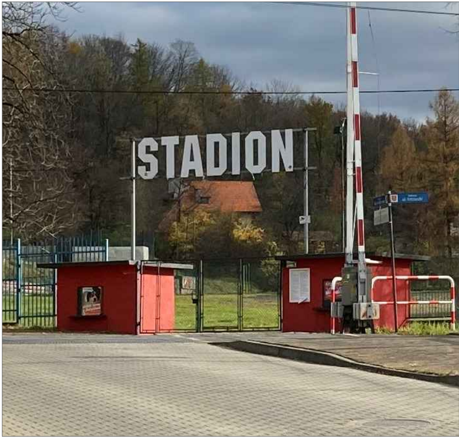
WIDOK KAS -FRONT